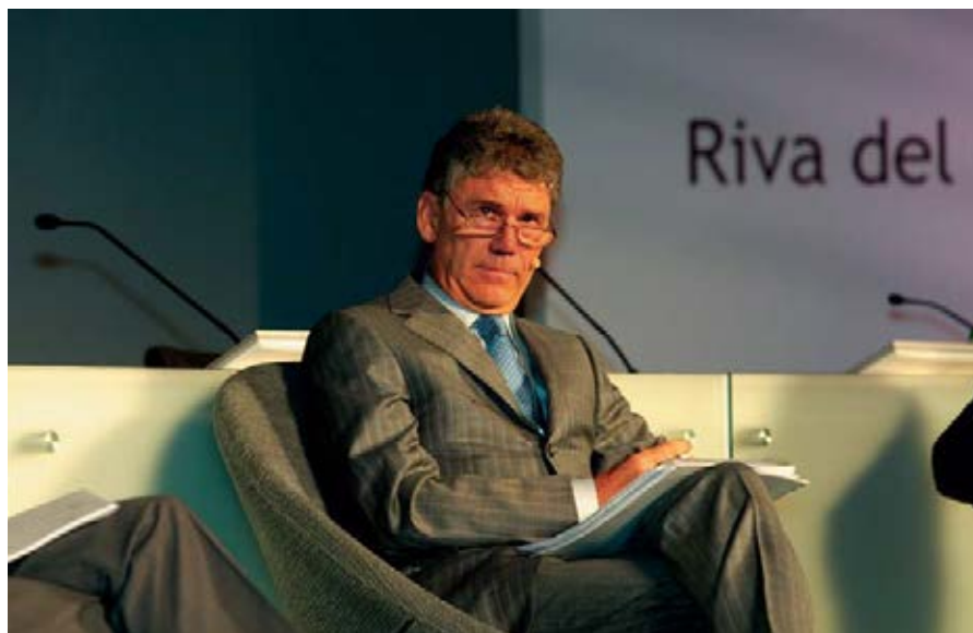
Il presidente del Consiglio Nazionale del Notariato, Paolo Piccoli durante una tavola rotonda nell'ambito del congresso

Temi come il confronto politico, la tariffa, i protocolli, la personalità della prestazione, la formazione permanente, la promozione dei valori del Notariato, la comunicazione, la conciliazione, il rapporto con le altre professioni, sono stati affrontati, dibattuti, votati sulla base di articolati ordini del giorno, costituendo un corpus molto ricco di indicazioni per il Consiglio Nazionale. Forse per la prima volta l'assemblea è stata tale, superando quei momenti di desolante fuga verso i propri studi che