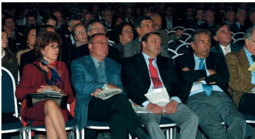
Notai in sala durante la presentazione della "Carta Oro"