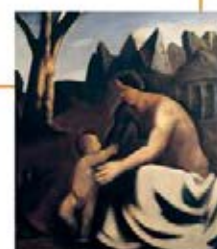
Mario Sironi. La famiglia del pastore, 1929. Olio su tela, cm 167x210. Particolare.