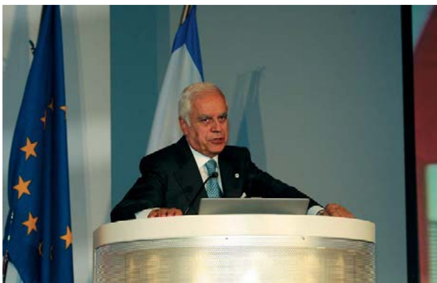
L'intervento del notaio Giancarlo Laurini, presidente dell'U.I.N., e deputato di Forza Italia

“ Inaccettabile e mortificante l'inasprimento del prelievo fiscale sulla fascia alta delle pensioni percepite dai notai sotto forma di contributo di solidarietà ”