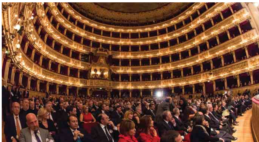
Una veduta dei congressisti al San Carlo, durante la prima giornata di lavori

Da ultimo, in questa sede, occorre accennare al confronto delle Casse con la Covip, proprio per cercare di definire congiuntamente quali debbano essere le regole di controllo. L'obiettivo è individuare gli elementi di omogeneità che permettano un controllo più attendibile dei risultati. In particolare si sta lavorando su un nuovo modello 703 - in un aperto confronto con gli organi di controllo - il quale costituirà la base per la preparazione di un nuovo documento che dovrà contenere i criteri di investimento per la previdenza obbligatoria e non solo per quella complementare.