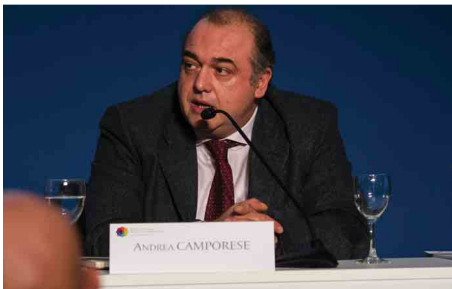
Il presidente dell’AdEPP, Andrea Camporese

Proprio per tale ragione la Cassa del Notariato, così come altri consigli di amministrazione di Casse professionali, ha deciso di non effettuare il versamento. Ciò non significa rifiutare aprioristicamente una richiesta del legislatore, ma - nell’attesa di una decisione della magistratura - porre, in parte, rimedio al problema della illegittimità della introduzione delle Casse previdenziali private nell’elenco Istat. In materia, l’Adepp ha già assunto una posizione secondo cui l’inclusione nel suddetto elenco configura un atto di lesione della soggettività giuridica e dell’autonomia delle Casse di previdenza che potrebbe anche essere oggetto di ricorso alla Corte Costituzionale. Per fortuna dovrebbe esser stato scongiurato il pericolo dell’introduzione nella legge di stabilità della previsione della possibilità di alienazione a favore degli inquilini (a determinate condizioni) di immobili di proprietà delle Casse professionali e quindi aventi destinazione residenziale a prezzi parametrati sui canoni di locazione. Pur comprendendo che la norma sarebbe destinata a soddisfare determinate esigenze sociali (gli sfratti stanno salendo di numero soprattutto nei grandi centri) occorre rilevare che non si può caricare il peso della norma solo su un soggetto privato che già partecipa alla spesa sociale attraverso i meccanismi fiscali; di più, per le Casse di