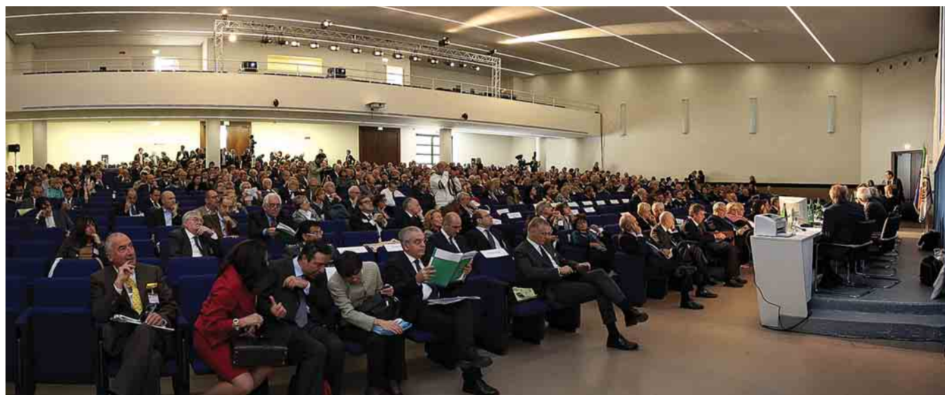
Una veduta dei congressisti, durante la seconda giornata dei lavori

Ma è dal punto di vista logico che il provvedimento appare assolutamente incongruo. Le Casse non sono destinatarie di finanziamento pubblico e tuttavia i risparmi (realizzati o meno) in base alla normativa dovrebbero essere versati nelle casse dello