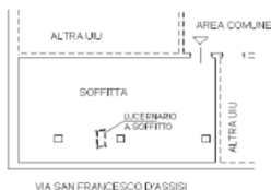
SOFFITTA - PIANO SOTTOTETTO H=2.00m

PIANO TERRA rispetto a via Baluardo Partigiani PIANO SECONDO rispetto a via San Francesco d'Assisi